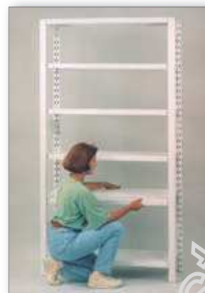
A közbenső polcok 4-4 db polctartó kapocsra vagy hossztartópárra helyezése.