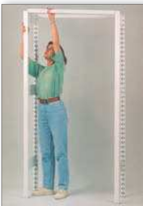
Az állványkeretek összekapcsolása alul és felül a hossztartókkal.

Polcok behelyezési sorrendje: felső polc majd alsó polc elhelyezése a hossztartókba, közbenső polcok elhelyezése hossztartókba, majd polctartó kapcsokra