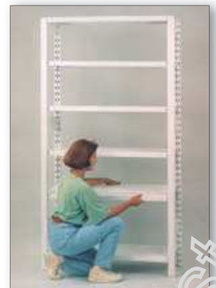
A közbenső polcok 4-4 db polctartó kapocsra vagy hossztartópárra helyezése.