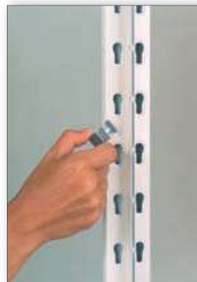
Polctartó kapcsok beillesztése az állványkeretbe.