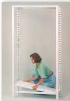
Az acélpolcok hossztartókra helyezése alul és felül.